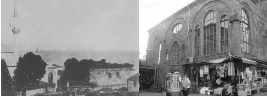
Şekil 1. Çarşı Cami ve Bedestenin 1950'lerdeki görüntüsü ile caminin bugünkü durumu

Alanda yer alan tescilli binalar oldukça fazla olup, Tarihi PTT binası, Semerciler Cami, Sabırhan, Taşhan, Çarşı Cami ve Şadırvanı, Bedesten, Paşa Hamamı, Müftü Cami, Hacı Yahya Cami ve Vakıfhan en önemli tarihi ve kültürel yapılarıdır (Şekil1,2, 3).