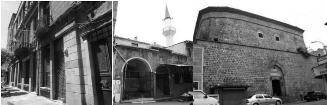
Şekil 3. Sırasıyla Eski PTT Binası, Semerciler Cami ve Bedesten, (Candaş Kahya, 2007; URL 3)

Bölge kentin ticaret aksı üzerinde yer almakta olduğu için yapı yoğunluğu oldukça fazladır. Ticaretin yoğun olması nedeniyle, ticarethane olarak tasarlanan yapıların çoğunluğu aynı işlevine devam ederken, sayısal olarak az da olsa konut olarak tasarlanan yapıların çoğunluğu ticaret yapısına dönüştürülmüş ve özgün işlevi değişmiştir. Zamanında konut olup bugün ticarethane olan yapıların büyük bölümünde; alt kat mağaza, üst kat depo ya da her iki kat mağaza, her iki kat depo olan işlev dağılımlarına rastlanmaktadır. Bu