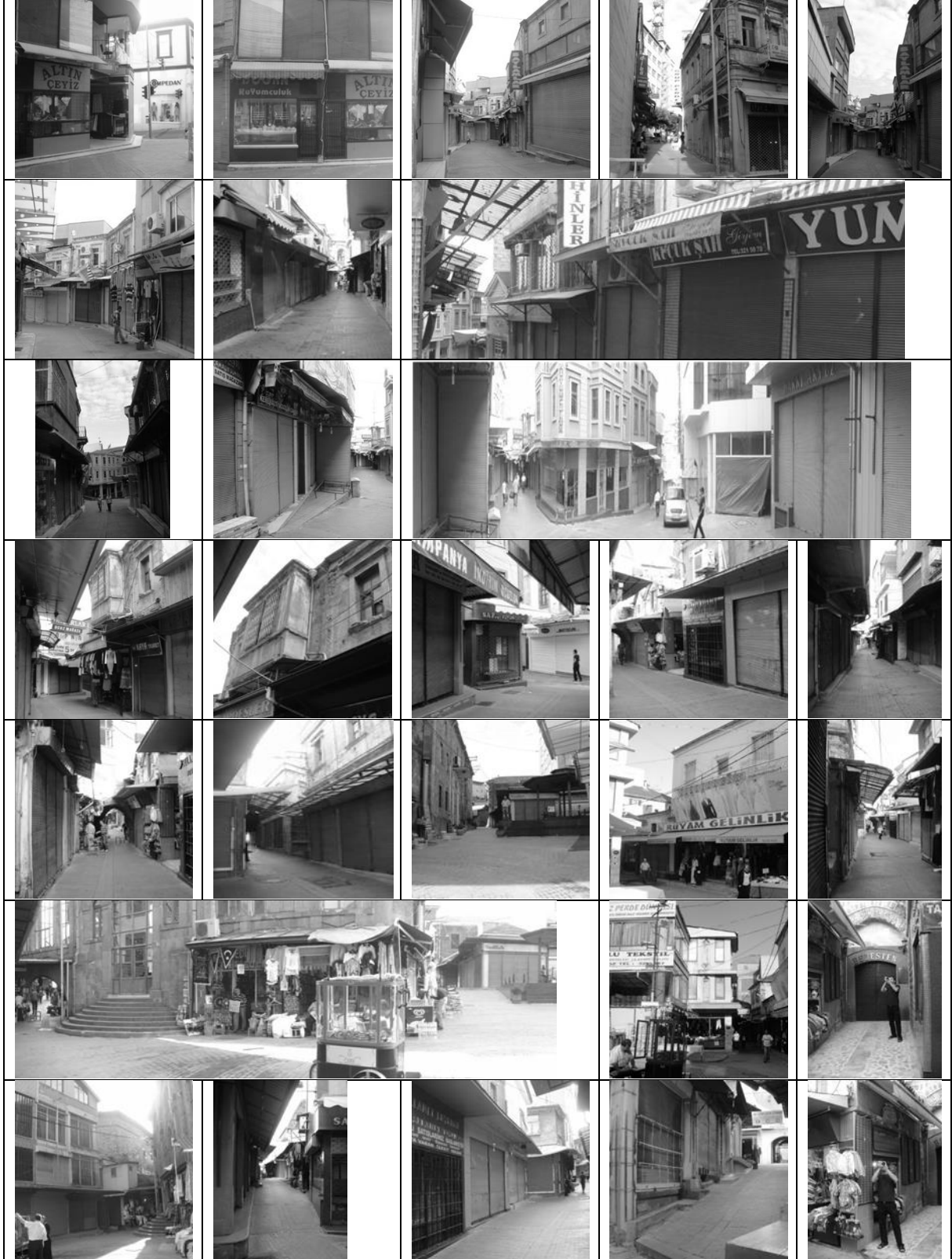
Şekil 5. Semerciler-Kemeraltı sokağından görünüm