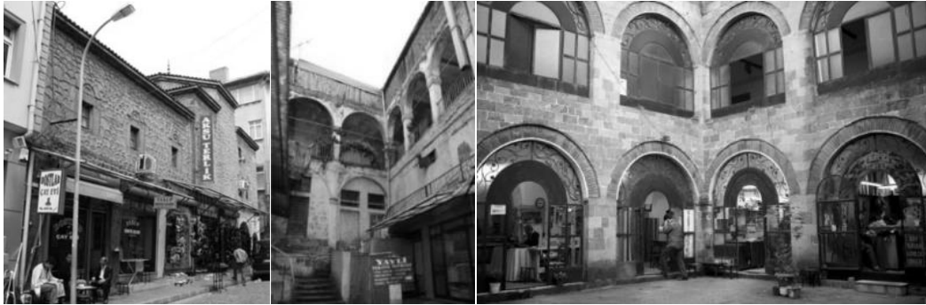
Şekil 2. Sırasıyla Vakıfhan, Sabırhan ve Taşhan, (Candaş Kahya, 2007; URL 3)