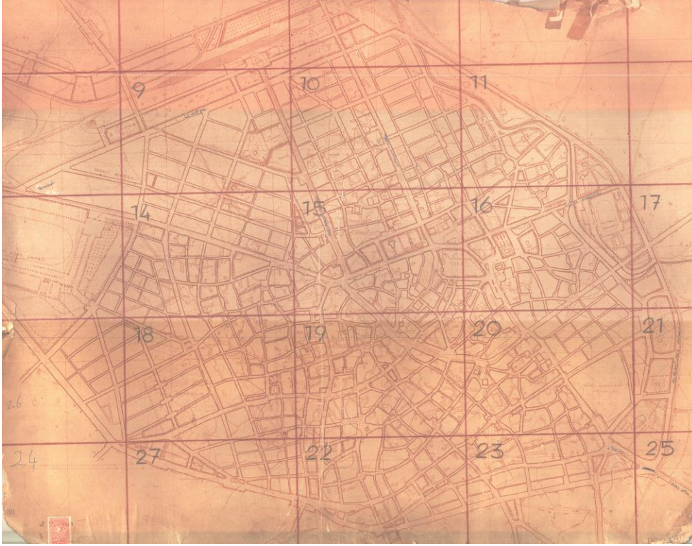
Şekil 2. Oelsner tarafından hazırlanan 1/5000 ölçekli imar planı (Kayseri Büyükşehir Belediyesi İmar Müdürlüğü Arşivi)

Çabuk'un (2019, s.287) da belirttiği gibi "alt ölçekli planlar ise Oelsner'in İTÜ'de yardımcılığını yapan Mimar Doç. Kemal Ahmet Aru'nun başkanlığında Kayseri Belediyesi'ne bağlı bir mimari büroda çizilmiştir".