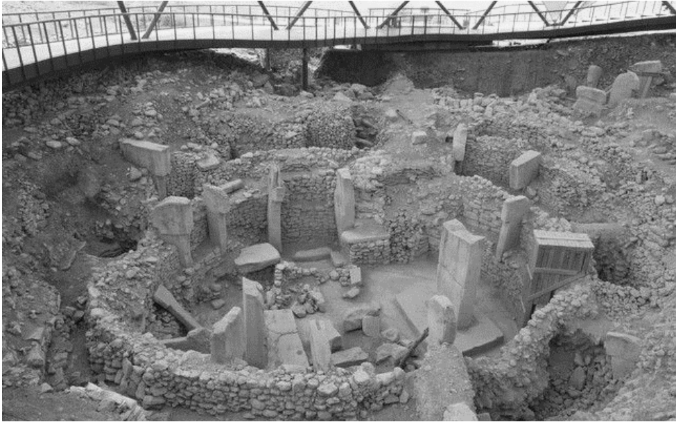
Şekil 1: Göbekli Tepe Kazı Alanı

Din, inanç gibi faktörler, homo sapiens'i diğer canlılardan ayırt edecek olan soyutlama yeteneğinin açığa çıkmasıdır. Bir konut ve tapınak yapısı olarak -diğer yerlerden farkı: tapınak yapısı sayısının çok olması- Göbekli Tepe'de de; insanın soyutlama yetisinin ortaya çıkışı, bir ruhban sınıfının bu organizasyonu gerçekleştirmesi ve tüm bunların mekana - kutsal mekan- yansması görülmektedir. Ayrıca sonrasında 'tapınak ekonomisi' de görülmektedir. Göbekli Tepe'ye belli sayıdaki elit insanlar girebilmektedir. Elit/ruhban sınıfının sosyal yaşamı, ekonomiyi vb. kontrol altına aldığı sistemin başlangıcıdır (Özdoğan, 2019).