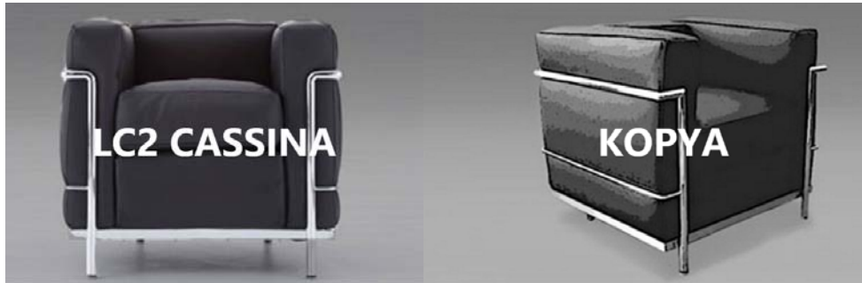
Resim 6. Le Corbusier'in LC2 isimli tasarımı (URL-9, 2016)

Taklit edilen kopyalar çoğunlukla orijinal tasarımlarla aynı amaca yönelik kullanılmaktadır. Ancak metal kısım işlemleri, dikiş aralıkları, fırçalama tekniğinin kullanımı, parlaklığı, orjinal malzeme kullanımı, yumuşaklığı ve sağlamlığı ise birbirinden tamamen farklıdır. Buradaki yapım tekniği ve kullanılan malzemeler farklılıkları ortaya koymaktadır.