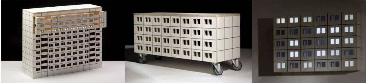
Resim 8. Konut Bloklarını Taklit Eden Mobilyalar; Panelak etejer, etajer, hareketli bir masa ve bir duvar lambası (URL-10, 2016)

Slovak tasarım stüdyosu, Laššák formunu bir binanın cephesinden alan mobilya tasarımları ile toplu konut imajını mobilyaya taşıyan ofis, ev içinde blok replikalarını yapmıştır. Ofisin tasarladığı Panelak adındaki seri bir etajer, hareketli bir masa ve bir duvar lambası, taklit edilen cephelerin küçük birer kopyasıdır (URL-10, 2016), (Resim 8).