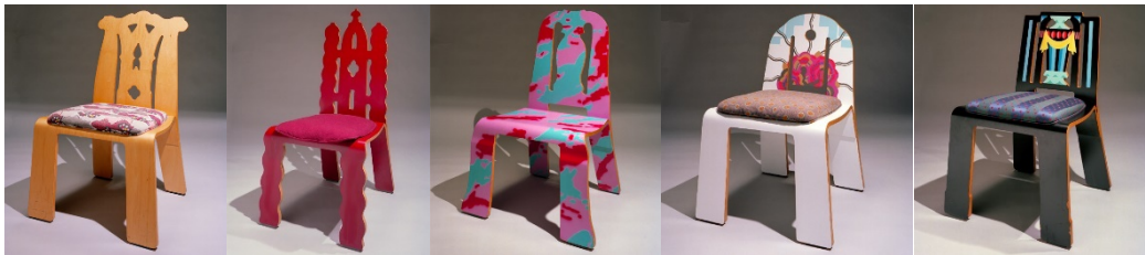
Resim 1. Chippendale Sandalyesi, Gothic Revival Sandalyesi, Queen Anne Sandalyesi, Art Deco Sandalyesi, Sheraton Sandalyesi (URL-4, 2016).

Taklit kavramı, öykünme kavramının içinde de kullanılmaktadır. Öykünme; birinin yaptığı gibi yapmak, birine veya bir şeye benzemeye çalışmak, taklit etmek olarak tanımlanmıştır (TDK, 2014). Ancak Doğan Kuban'ın dediği gibi "Öykünme bir yere kadar iyidir, ancak o 'bir yerden' sonra işin içine yaratıcılık girmezse bu büyük bir probleme dönüşür." (URL-3, 2016). Bu nedendir ki taklit yaparken, aynısını veya benzerini çoğaltmak anlamına gelen kopyalama yapmaktan kaçınmak gerekir. Tasarım adına bir işe başlama onu geliştirme ve ürüne dönüştürmeyi kapsayan bu süreçte önemli olan yaratıcı ve özgün fikirler ortaya koyma ve bunu gerçekleştirme işlemidir (Kurak Açı, 2015). Postmodern dönemin ünlü mimarlarından Robert Venturi ve Denise Scott Brown'de Modernizmin fikirleriyle uyumlu, kolay ve ucuza üretilebilecek dekoratif unsurları ekleyerek tarihten öykündüğü mobilyalar tasarlamıştır. Bunu tarihi stilleri araştırmanın yeni bir yolu olarak görmüş ve postmodern ilkelerini "mimarlık kültürü etrafında dönmek" için kullanmak olarak tanımlamıştır. Bu amaçla Chippendale, Kraliçe Anne, İmparatorluk, Hepplewhite, Sheraton, Biedermeier, Gotik Revival, Art Nouveau ve Art Deco dahil olmak üzere geniş bir yelpazedeki önemli tarihi mobilya stillerini içeren bir koleksiyon tasarlamışlardır (URL-4, 2016), (Resim 1). Ancak, tarih, yeni bir tasarımda tek ve mutlak kaynak haline gelirken, mimari çeşitliliğin nasıl geliştirilebileceği tartışma konusu olmuştur (Güleç, 2013).