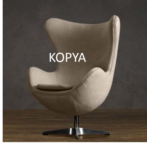
Resim 9. Arne Jacobsen'in Yumurta Sandalyesi (URL-11, 2016)

Çalışmada; örnek olarak ele alınan mobilyalar, en temel özelliklerine göre sınıflandırılarak tartışılmıştır. Ancak mobilyaların aynı zamanda farklı yollarla da taklit edildikleri görülmektedir. Bu nedenle ele alınan örnekler için tüm taklit yolları için aşağıda yer alan tablo hazırlanmıştır.