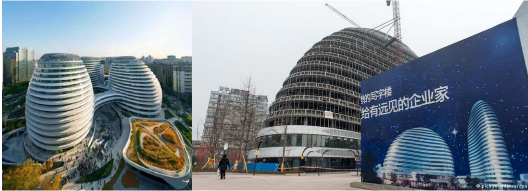
Resim 2. Zaha Hadid'in tasarımı "wangjing soho" ve kopyası (URL-7, 2016)

kopyadır”,sembolik öneme sahip yapıların bile bugün birer kopyası vardır demiştir (URL-6, 2016).