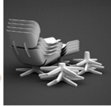
Resim 4. Eames Lounge Chair(URL-8, 2016)

Le Corbusie'in LC2 isimli tasarımı da Dirk Winkel tarafından malzemesi değiştirilerek (plastik) forma dayalı taklit edilmiştir. Tasarımda iç içe geçmeli bir tasarım anlayışı verilmeye çalışılsa da tekrara düşülerek kopya edilmiştir (URL-8, 2016), (Resim 5).