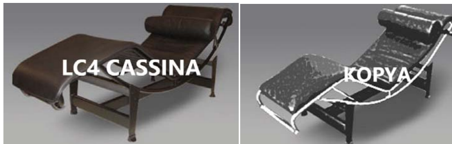
Resim 7. Le Corbusier'in LC4 isimli tasarımı (URL-9, 2016)