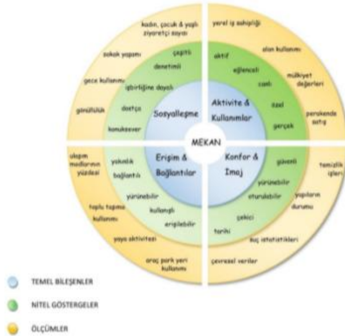
Şekil 1. İdeal mekanın bileşenleri

bu özelliklerin nitel olarak belirttikleri soyut bileşenlerini ve nicel olarak yapılabilecek ölçümlerini Şekil 1’de verilen diyagram ile görselleştirmişlerdir. PPS (2014) tarafından geliştirilen bu 4 kriter araştırmanın yöntemi için bir altlık oluşturmuş ve bu 4 kriter çerçevesinde analizler yapılmıştır.