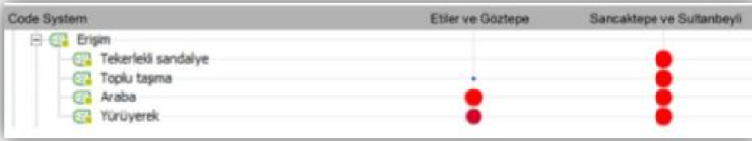
Şekil 3. Yüksek ve düşük sosyo-ekonomik dereceden kamusal mekanlarda erişim kodlarının sıklığı

Konfor ve imaj kodu altında yer alan alt kodlardan yürüyüş ve bisiklet yolu, parkta internet (wi-fi) kullanımının bulunması, canlılığı ile sessiz, güvenli ve huzurlu olması konusunda ortaya çıkan talep ve beklentilerin yüksek sosyo-ekonomik grupta düşük sosyo-ekonomik gruba göre sözlü görüşmelerde daha çok ifade edildiği belirlenmiştir. Çocuk oyun alanı, gençlere yönelik aktivite, kapalı oturma yerleri, su aktiviteleri ile bilim ve sanat temasına sahip bir kamusal mekan isteği ise düşük sosyo-ekonomik gruplarda daha çok ifade edilmiştir. Ayrıca, alanın genel durumundan memnun olduğunu ve ilave bir talep ya da isteğinin bulunmadığını dile getiren ifadeler de düşük sosyo-ekonomik gruplar tarafından daha çok dile getirilmiştir (Şekil 4).