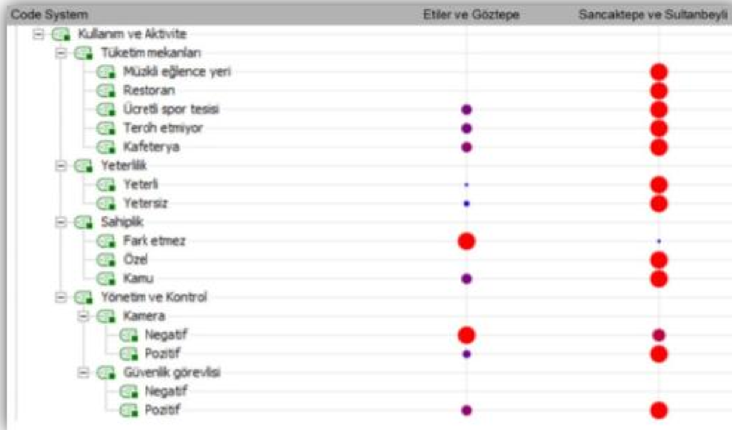
Şekil 5. Yüksek ve düşük sosyo-ekonomik grup kamusal mekanlarında kullanım ve aktivite kodlarının sıklığı

Kullanım ve aktivite kodu altında buldukları kamusal mekanda tüketim mekanları olarak kodlanan ücretli spor tesisi ile kafeterya talep düzeyleri ya da bu alanları kullandığını ifade etme düzeyi Sancaktepe ve Sultanbeyli parklarında daha yaygındır. Ayrıca yine tüketim mekanlarını tercih etmediğini ya da alanda yapılırsa da kullanmayacağını ifade etme düzeyi de düşük sosyo-ekonomik gruplarda daha yüksektir. Kullanım ve aktivitelerin yeterli ve yetersiz olması üzerine yine düşük sosyo-ekonomik gruplar da daha çok görüş bildirilmiştir. Ziyaret ettikleri alanın kamu sahipliği olması gerektiğini daha çok düşük sosyo-ekonomik derecelerden parkların ziyaretçileri belirtirken, bu konuda yüksek sosyo-ekonomik derecedeki parkların ziyaretçilerinde fark etmez kodlu yanıtlar daha yaygın bulunmuştur. Buldukları mekanların yönetim ve kontrolü üzerine konuşulduğunda yüksek sosyo-ekonomik gruptakiler alanda kamera kullanımı ya da bulunması üzerine negatif görüşlerini daha detaylı olarak bildirirken, düşük sosyo-ekonomik grup içerisinde kullanıcılar kamera kullanımı hakkında pozitif görüşlerini daha detaylı ve ayrıntılı olarak ifade etmişlerdir. Kamusal mekanda güvenlik görevlilerinin bulunması hakkındaki pozitif görüşler de yine düşük sosyo-ekonomik gruplarda daha fazla bildirilmiştir (Şekil 5).