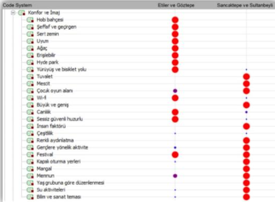
Şekil 4. Yüksek ve düşük sosyo-ekonomik dereceden kamusal mekanlarda konfor ve imaj kodlarının sıklığı

Konfor ve imaj kodu altında yer alan alt kodlardan yürüyüş ve bisiklet yolu, parkta internet (wi-fi) kullanımının bulunması, canlılığı ile sessiz, güvenli ve huzurlu olması konusunda ortaya çıkan talep ve beklentilerin yüksek sosyo-ekonomik grupta düşük sosyo-ekonomik gruba göre sözlü görüşmelerde daha çok ifade edildiği belirlenmiştir. Çocuk oyun alanı, gençlere yönelik aktivite, kapalı oturma yerleri, su aktiviteleri ile bilim ve sanat temasına sahip bir kamusal mekan isteği ise düşük sosyo-ekonomik gruplarda daha çok ifade edilmiştir. Ayrıca, alanın genel durumundan memnun olduğunu ve ilave bir talep ya da isteğinin bulunmadığını dile getiren ifadeler de düşük sosyo-ekonomik gruplar tarafından daha çok dile getirilmiştir (Şekil 4).