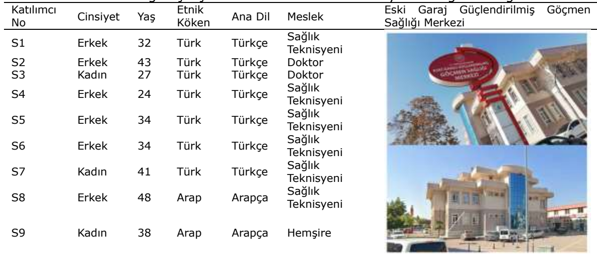
Tablo 8. Sağlık çalışanları katılımcılarına ait sosyo-demografik bilgiler

Çalışmanın bu aşamasında sağlık çalışanlarının dönütleri üzerinden elde edilen tematik içerik analizi bulguları ele alınmaktadır. Bu kapsamda, sağlık hizmetleri sürecinde iletişim ve bilgiye dayalı sorunların yaygınlığına, bu sorunların tedavi süreçlerine etkisine ve toplumsal cinsiyet normlarının sağlık hizmet sunumuna yansımalarına ilişkin bulgular incelenmiştir (bkz. Tablo 9).