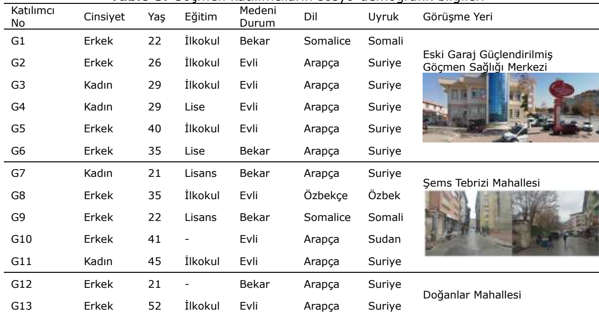
Tablo 3. Göçmen katılımcıların sosyo-demografik bilgileri

Bu çalışmada elde edilen bulguların değerlendirilmesi sürecinde, göçmenler ile sağlık çalışanları ayrı gruplar halinde ele alınmış, her iki gruba ilişkin veriler karşılaştırmalı ve bütüncül bir yaklaşımla analiz edilmiştir. Analiz sürecinde öncelikle göçmen katılımcılardan elde edilen bulgulara odaklanılmıştır. Göçmen katılımcıların sosyo-demografik özellikleri ile görüşmelerin gerçekleştirildiği mekânlara ilişkin bilgiler Tablo 3'te sunulmuştur.